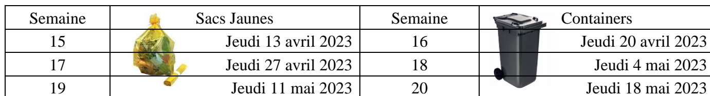
Tableau dates de collecte des containers (semaines paires) et sacs jaunes (semaines impaires)

Depuis le 1 er janvier 2023, le bulletin municipal est dématérialisé. Retrouvez-le sur le site de la commune ou sur l'application Intra-Muros. Le format papier reste disponible en mairie aux heures d'ouverture.